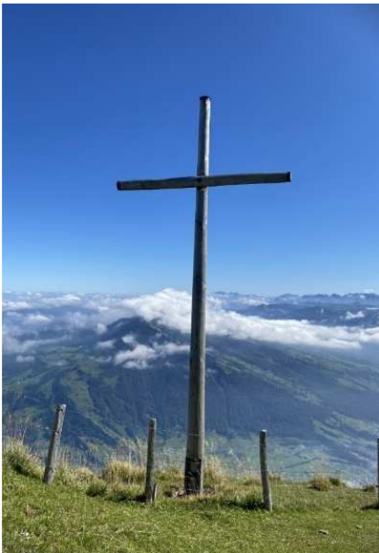
1.palkinto Kuva Rigiltä, Virpi Nyberg